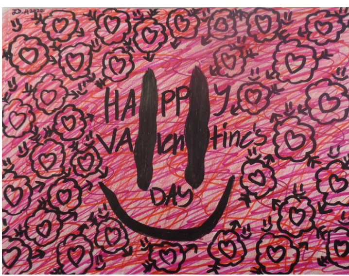
Happy Valentine's Day to Panthers Everywhere! Art by J.D. Mendez