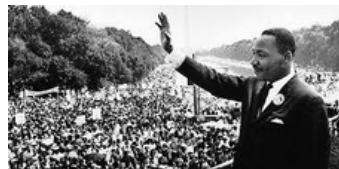
MLKJ at the March On Washington, D.C., 1963

"Mi sueño es que mis cuatro pequeños algún día vivirán en una nación donde no serán juzgados por el color de su piel, sino por el contenido de su carácter."