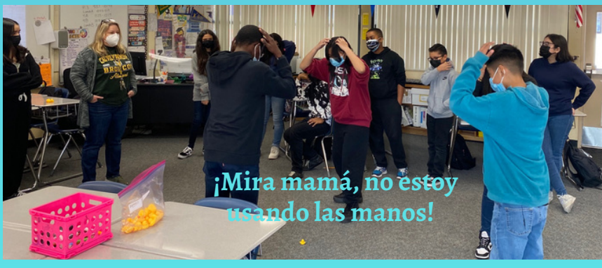
¡Mira mamá, no estoy usando las manos!