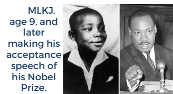
MLKJ, age 9, and later making his acceptance speech of his Nobel Prize.

¡Hoy, tengo un sueño! El 17 de enero, celebramos el natalicio de Martin Luther King, Jr. su vida y su papel el Movimiento de los Derechos civiles. Es famoso por protestar pacíficamente contra la injusticia contra las personas de color en los Estados Unidos desde mediados de la década de 1950 hasta que fue asesinado en 1968.